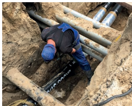
Fachgerechte Anbindung an die bestehende BRUGG-STAMANT®-Sicherheitsrohrleitung