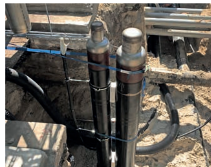
Ordnungsgemäße Sicherung und Befestigung der Anschlüsse