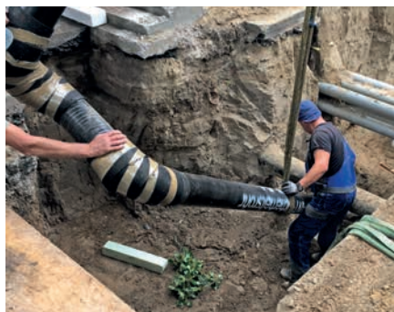
Verlegung des BRUGG-STAMANT®-Sicherheitsrohres mit viel Fingerspitzengefühl

Zwischen der im Vordergrund stehenden klimaneutralen Energieversorgung