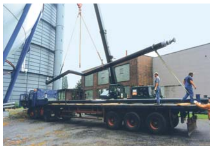
Entladen vorgefertigter, geprüfter Baueinheiten