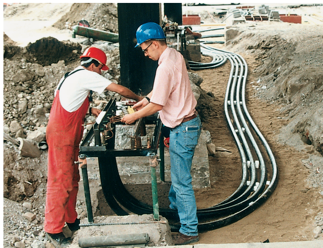
Facile installazione in cantiere