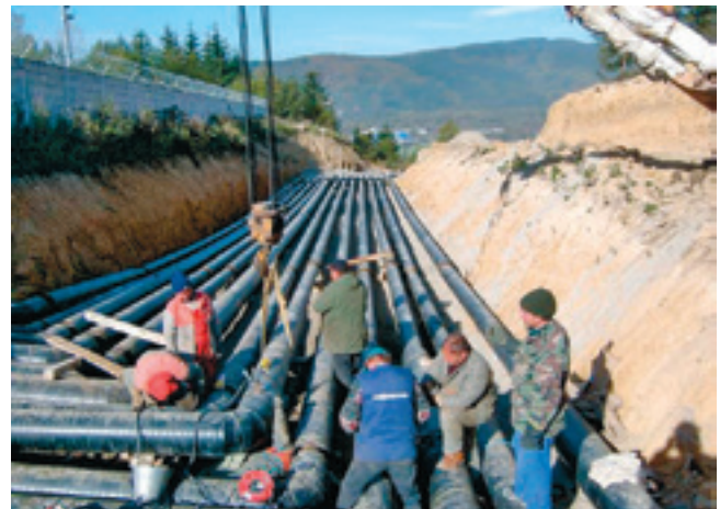
Montage des Außenmantels BRUGG-STAMANT®-Sicherheitsrohr

verzögerte sich der Autobahnaufbau. Das Projekt wurde verschoben und der Vertrag zwischen dem Generallieferanten DOPRASTAV AG (eine der drei größten Baugesellschaften in der Slowakei) und der Firma CHEMPROCES GmbH im Mai 2006 unterschrieben.