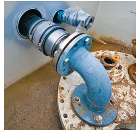
Fertig montierte Anschlussverbindung