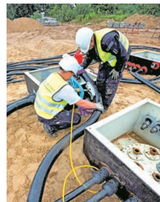
Biegen der Rohrleitung