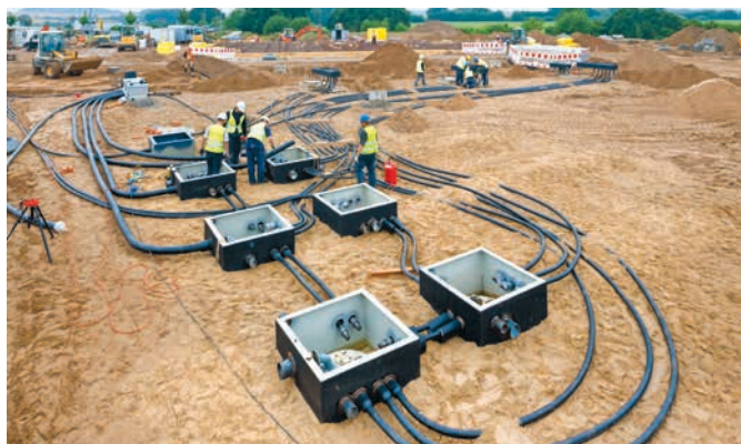
Gesamtansicht der Tankstellenbaustelle

Erste Termingespräche zwischen BRUGG und ARTELIA erfolgten im Februar 2013. BRUGG wirkte unterstützend bei der Erstellung des Rohrplans für die Nord-Seite. Für alle Produktleitungen wurden doppelwandige SECON®-X Leitungen geplant. BRUGG erhielt zunächst den Auftrag über die Lieferung