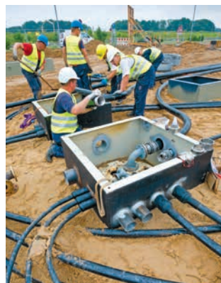
Einbringen der Füllleitung